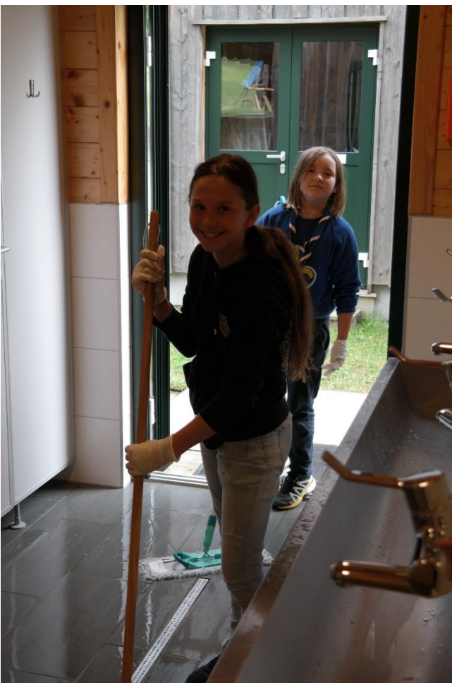
Große Freude beim Spezialabzeichen "Waschbär"