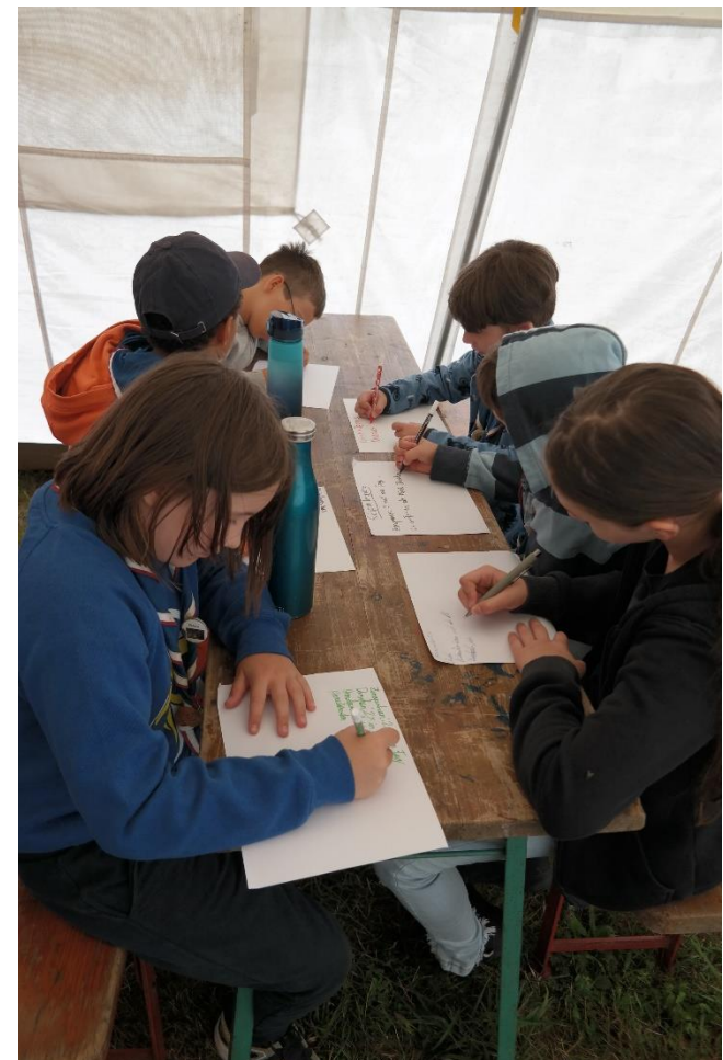
Volle Konzentration beim Spezialabzeichen