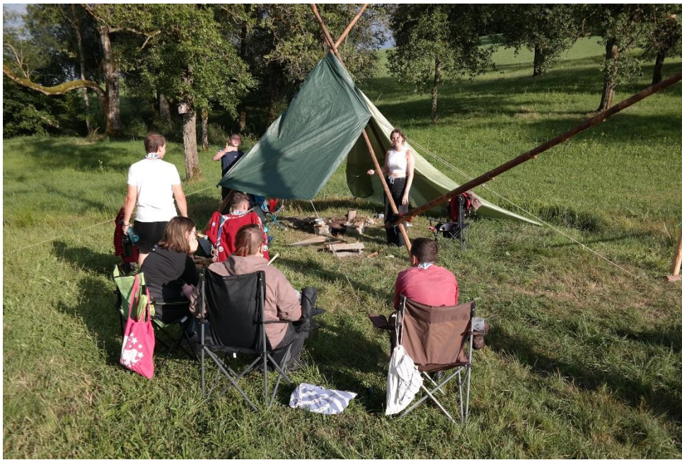
Das RaRo-Leitungsteam beobachtet die RaRo in erster Reihe fußfrei!