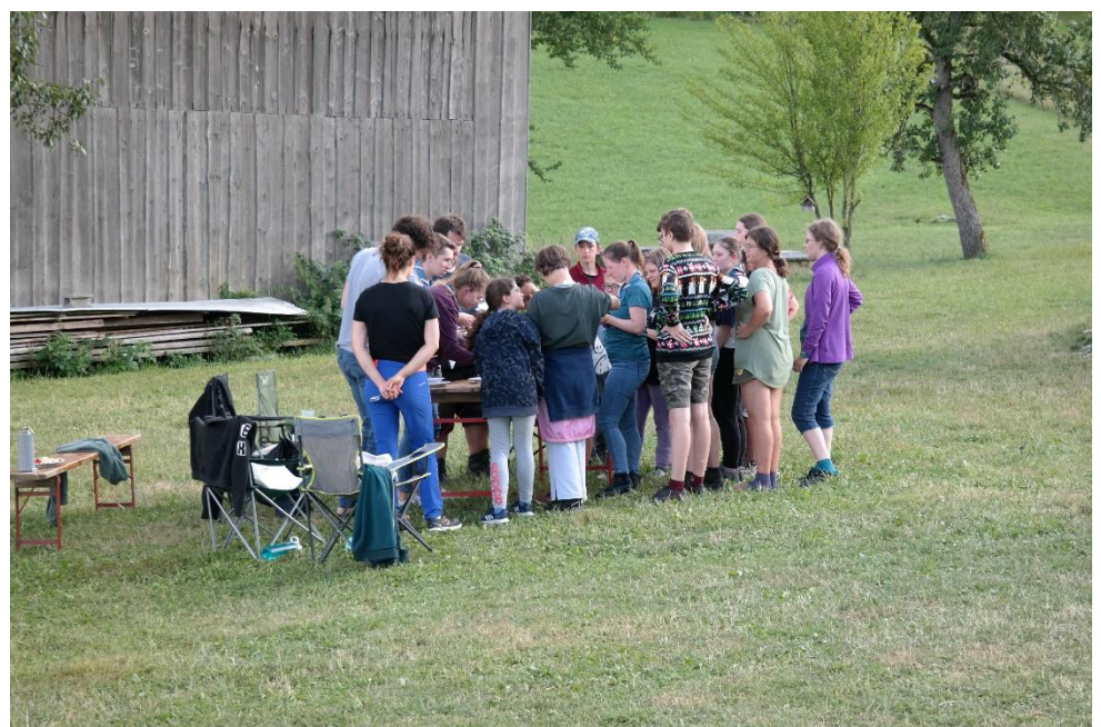
Wie werden die Tester wohl entscheiden?