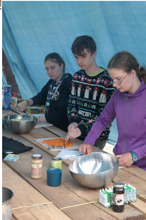
Akkurates Schneiden der CaEx