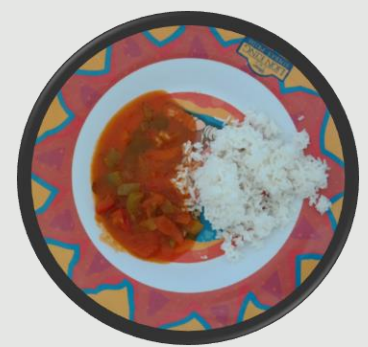
Letscho mit Reis