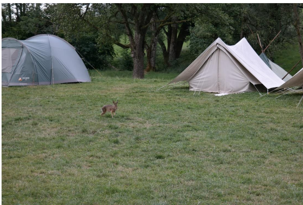
Unser Lagerhase besucht uns