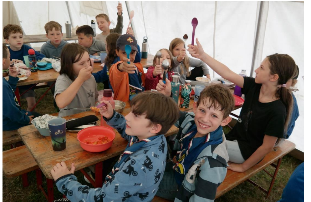
Es scheint den WiWö zu schmecken