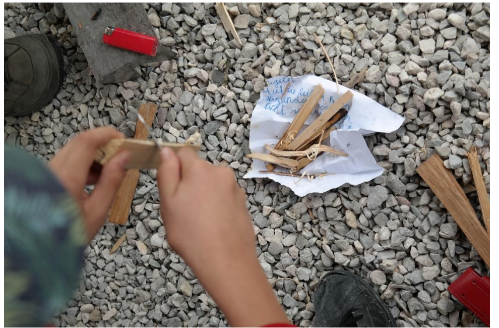
Ohne Holz kein Feuer..