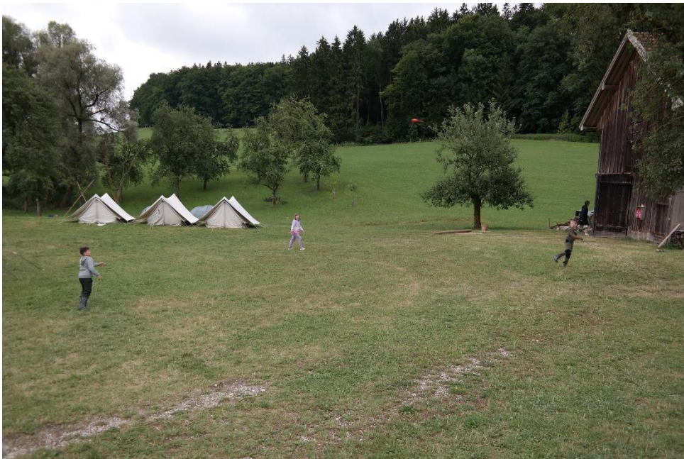
Wer sieht den "Heuler"?