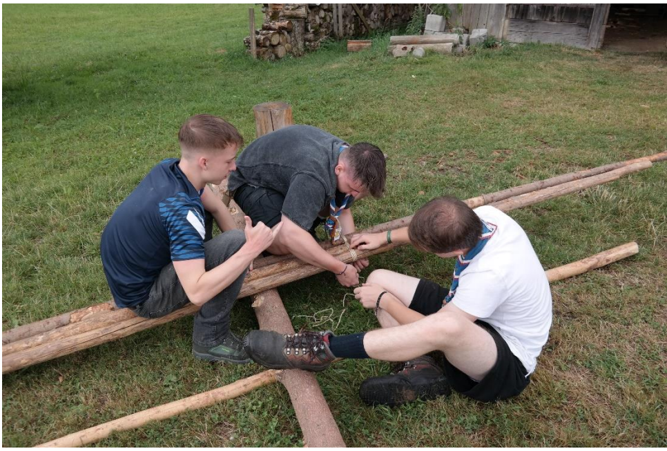
Die RaRo überdachen ihre Kochstelle