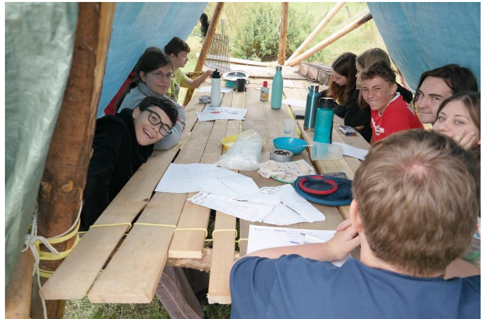
Die CaEx planen ihr Unternehmen