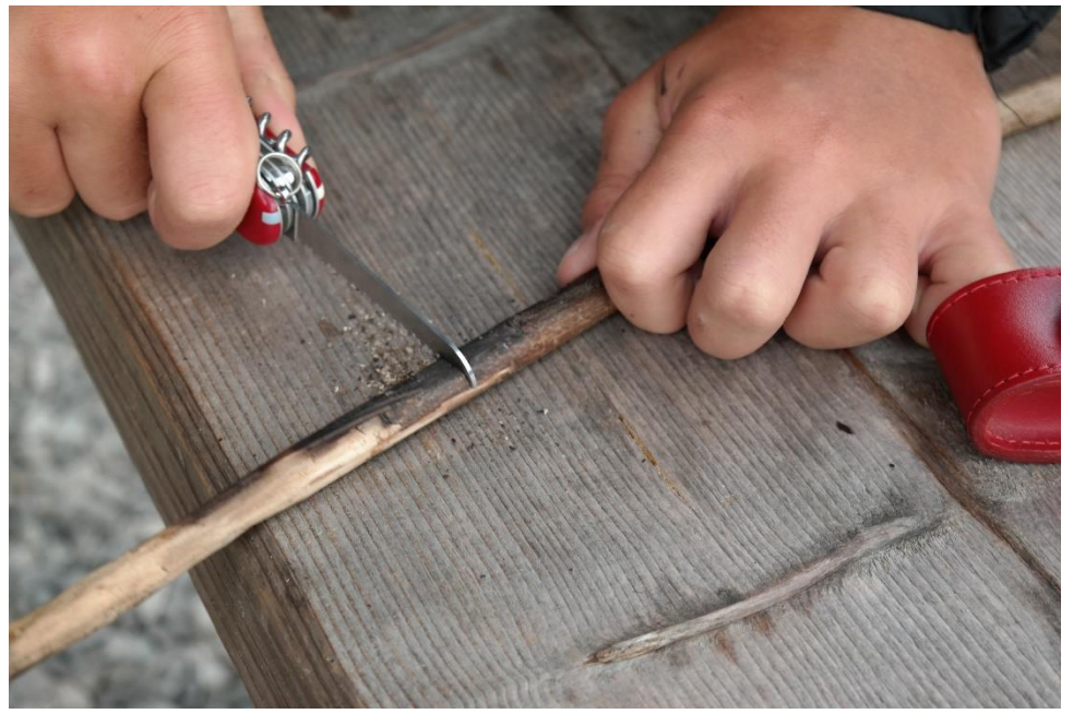
Was die GuSp wohl hier machen...