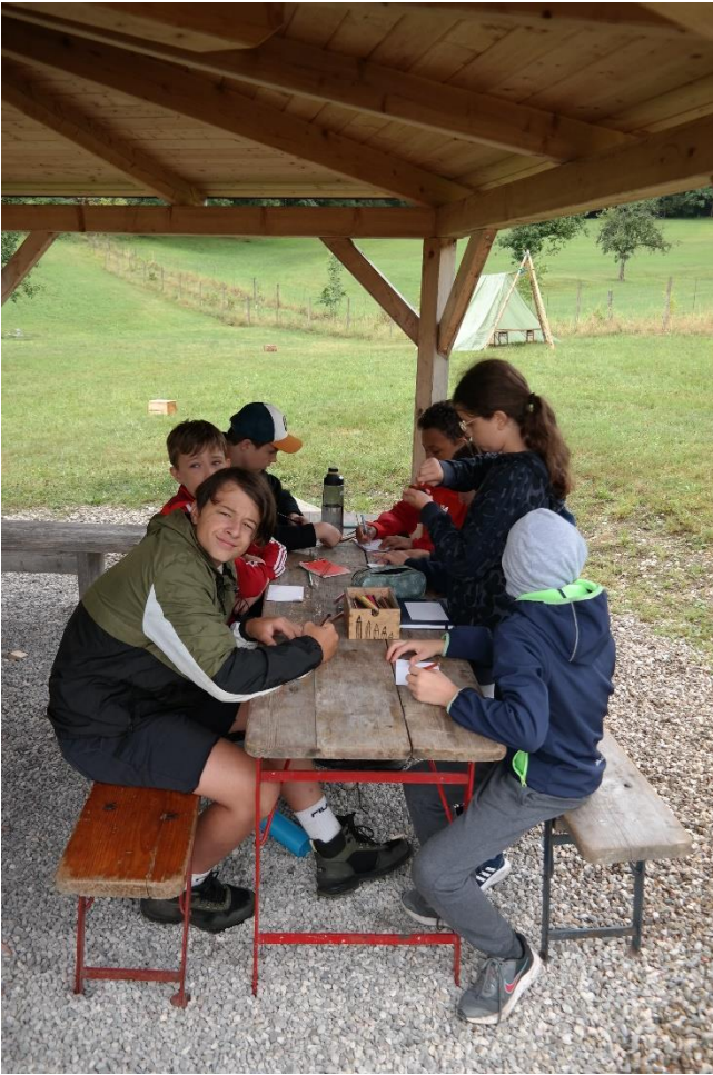
Die GuSp schreiben Postkarten