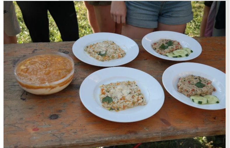
Vorspeise: Baba Ganoush mit in der Feuerschale gegrillten Melanzani Hauptspeise: Gemüserisotto Nachspeise: Mascarponecreme mit Biskuitboden und Pfirsich-Maracuja-Topping