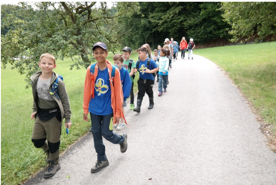
Die WiWö machen den Ort "unsicher"