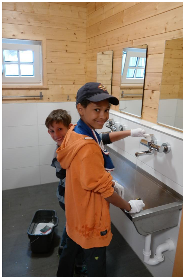
Auch die Waschstellen müssen gewaschen werden