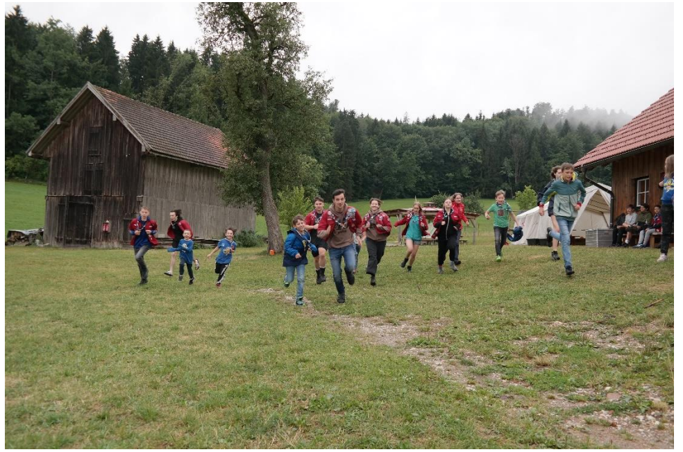
Das Morgenspiel "Alle Mann"