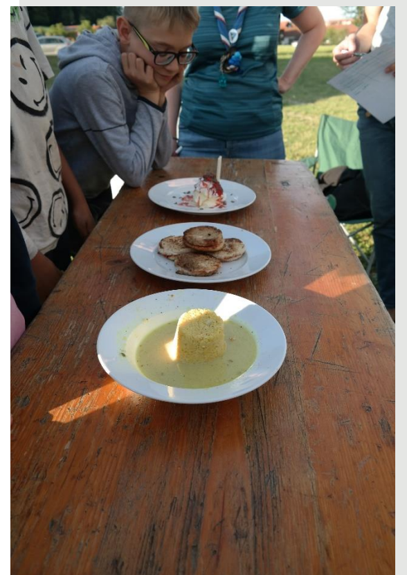
Vorspeise: Couscous mit Curry Hauptspeise: Pizzatoast Nachspeise: Vanilleeis mit Erdbeeren, Erdbeersauce, Schlagobers und Schokolade