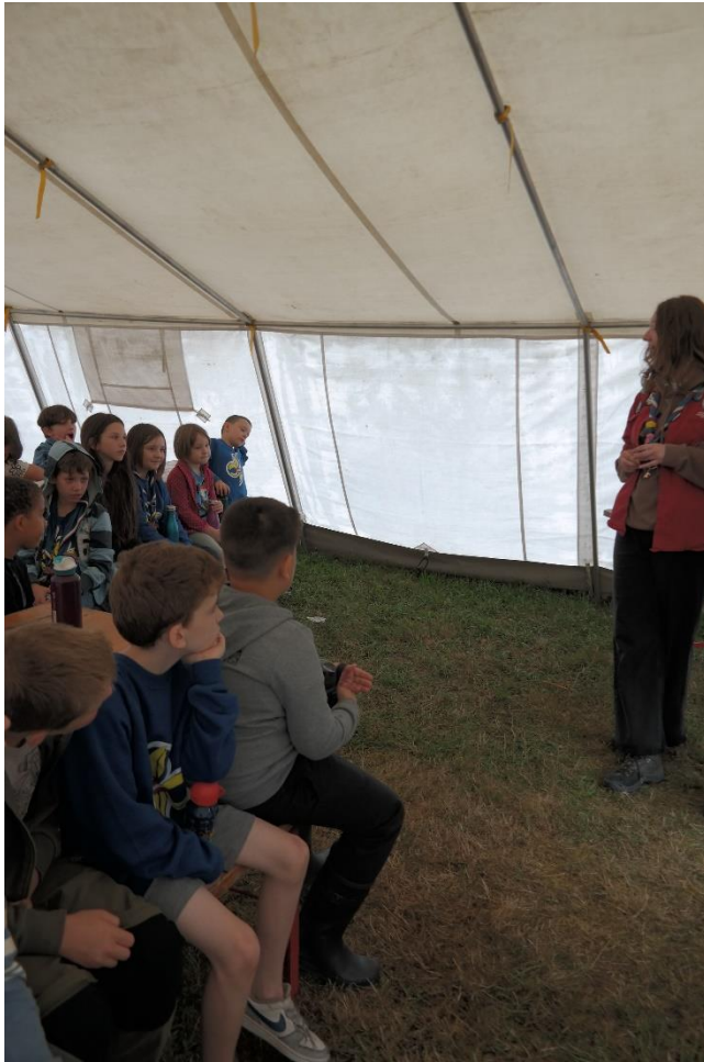
Einführung in das Spezialabzeichen "Gärtner"