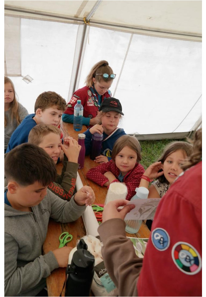
Die Gärtnerinnen und Gärtner lernen viel Neues