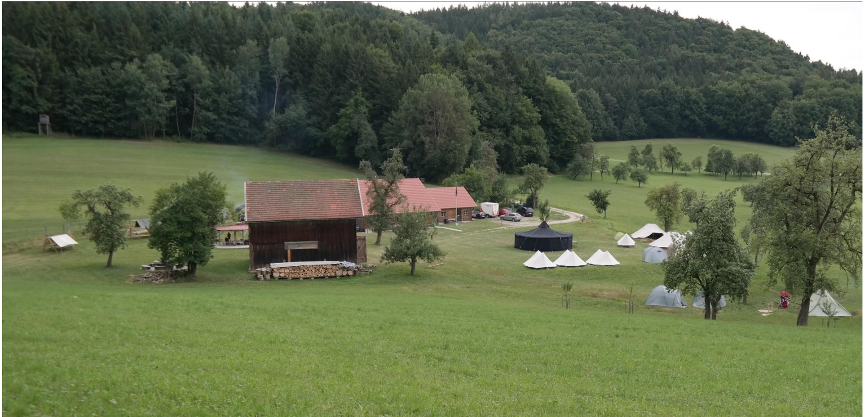
Unser Lagerplatz von oben