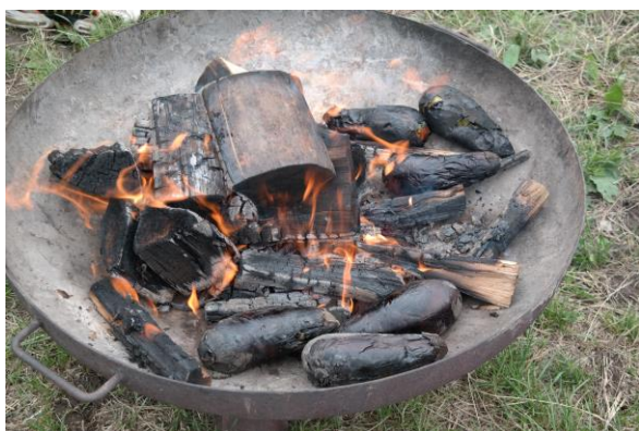
Wer findet die Melanzani?

Die Gewinner werden am Freitag prämiert, wir gratulieren aber jetzt schon beiden Teams zum Meistern dieser tollen Aufgabe, die wahrlich nicht einfach war!