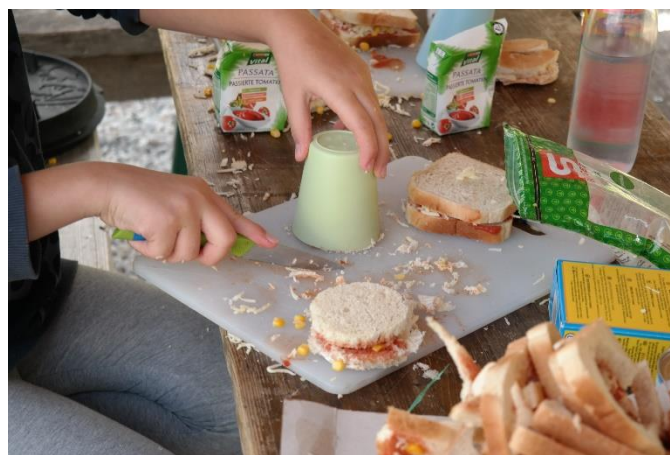
Die Pizzatoasts werden ausgeschnitten