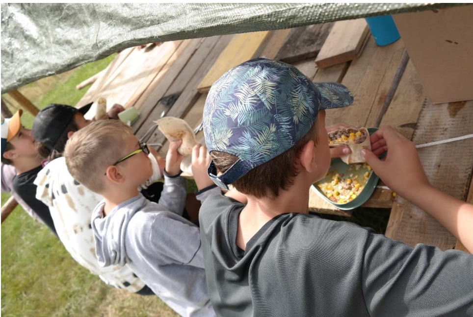
Den GuSp schmeckt es