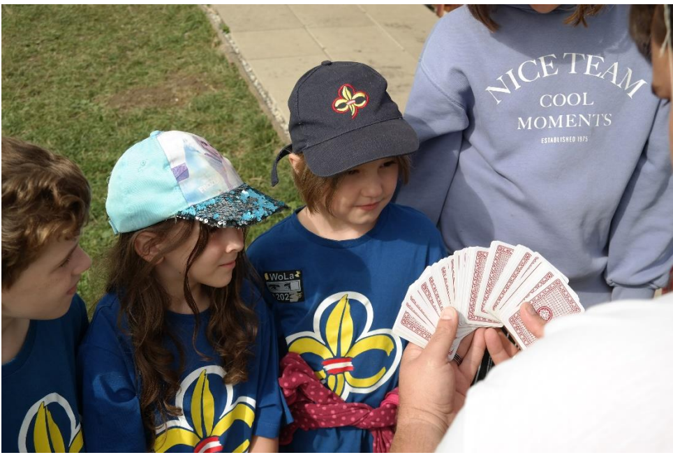
Magic Mike zeigt einen neuen Trick