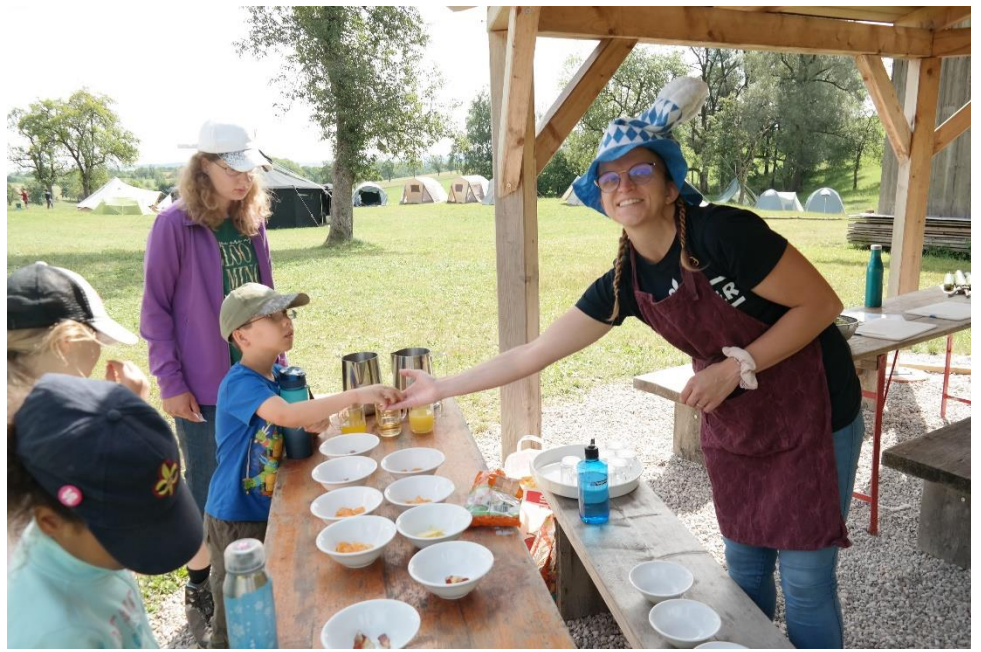
In der Gastwirtschaft