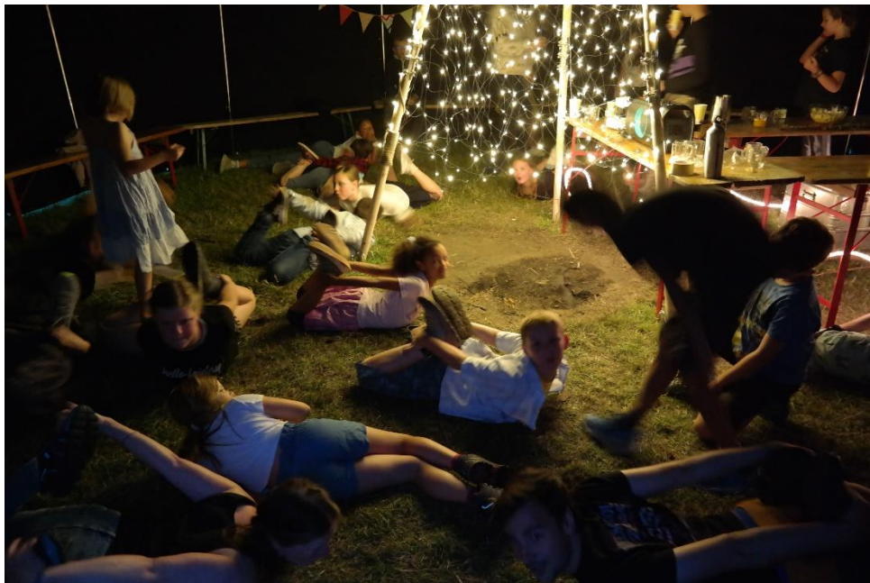
Auch die "Robbe" darf nicht fehlen