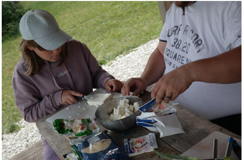
Vorbereitungen des Mittagessens