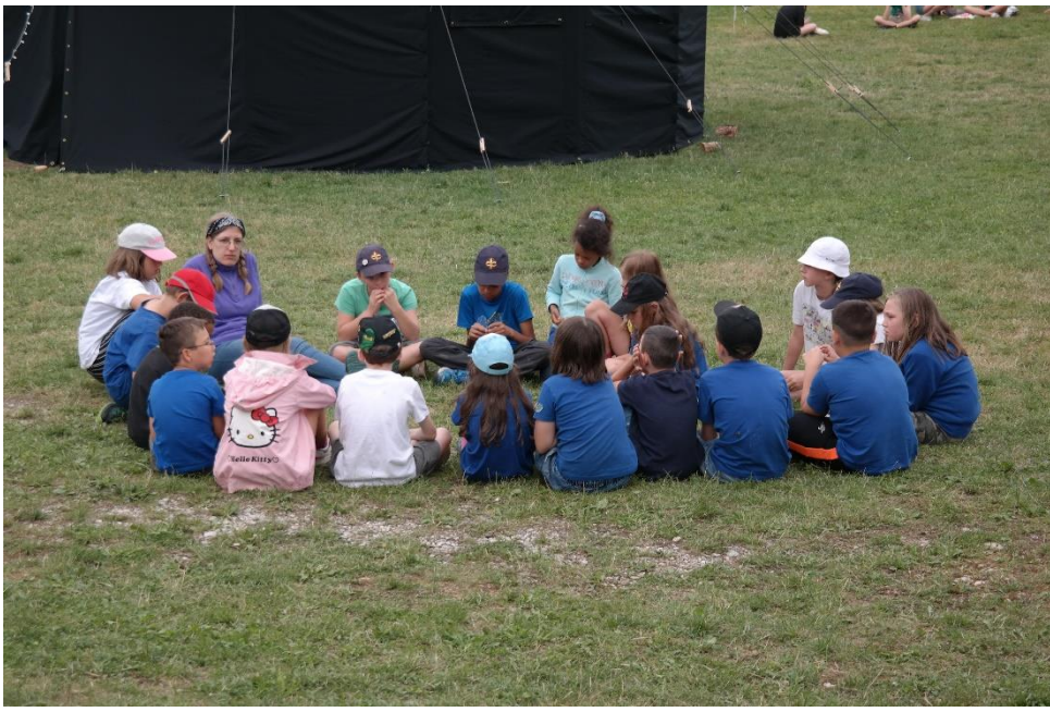
Ojeh, die WiWö waren schlimm...da muss ein Sitzkreis her!