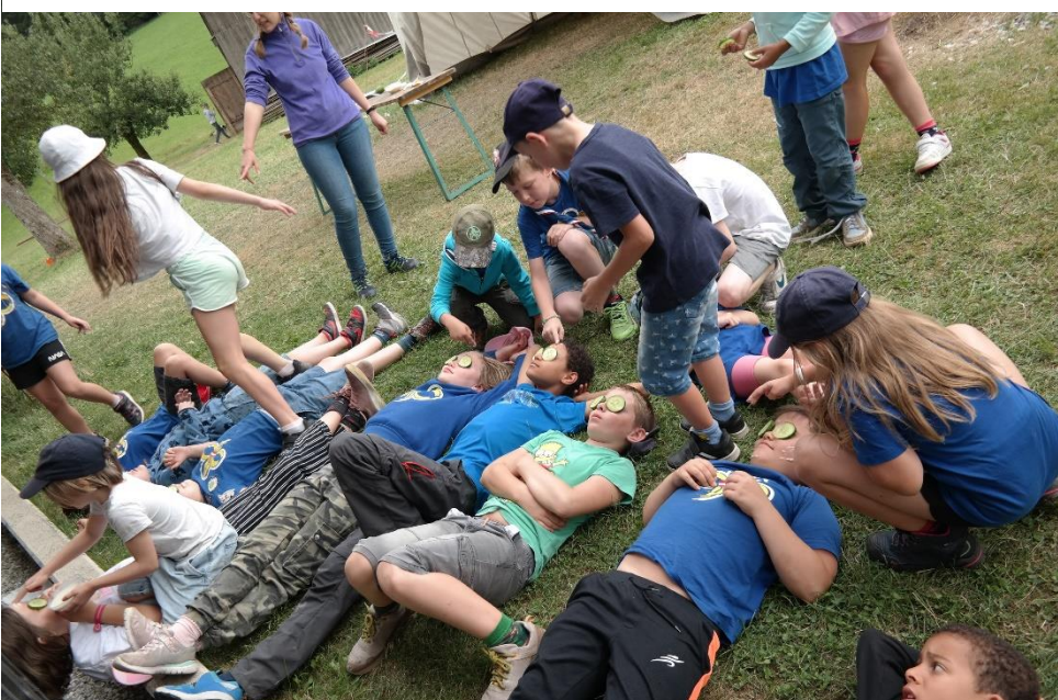
Beautytag bei den WiWö