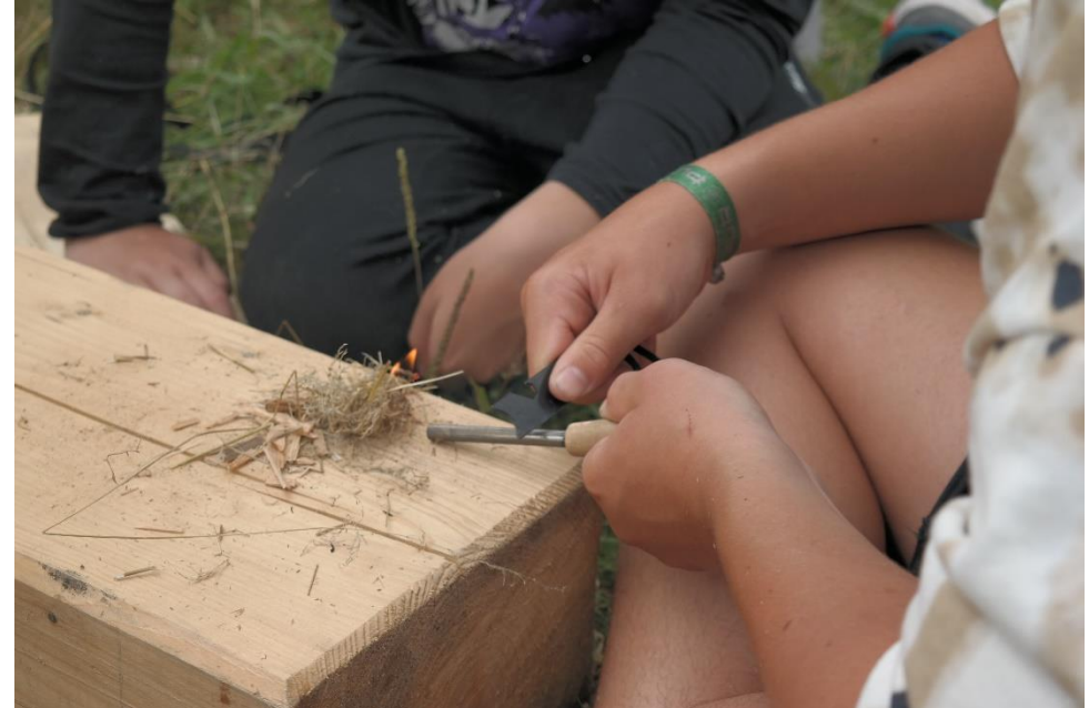
...man sieht schon eine Flamme!