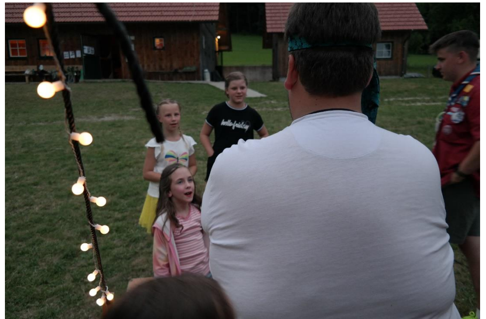
Lässt der Türsteher alle herein?