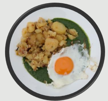
Spinat mit Spiegelei und Erdäpfelschmarrn