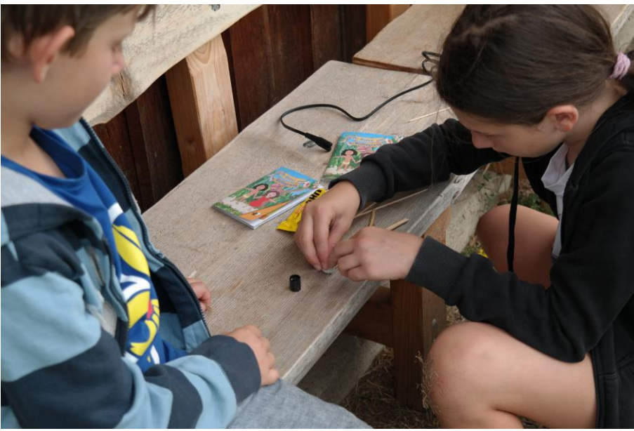
WiWö beim Ablegen