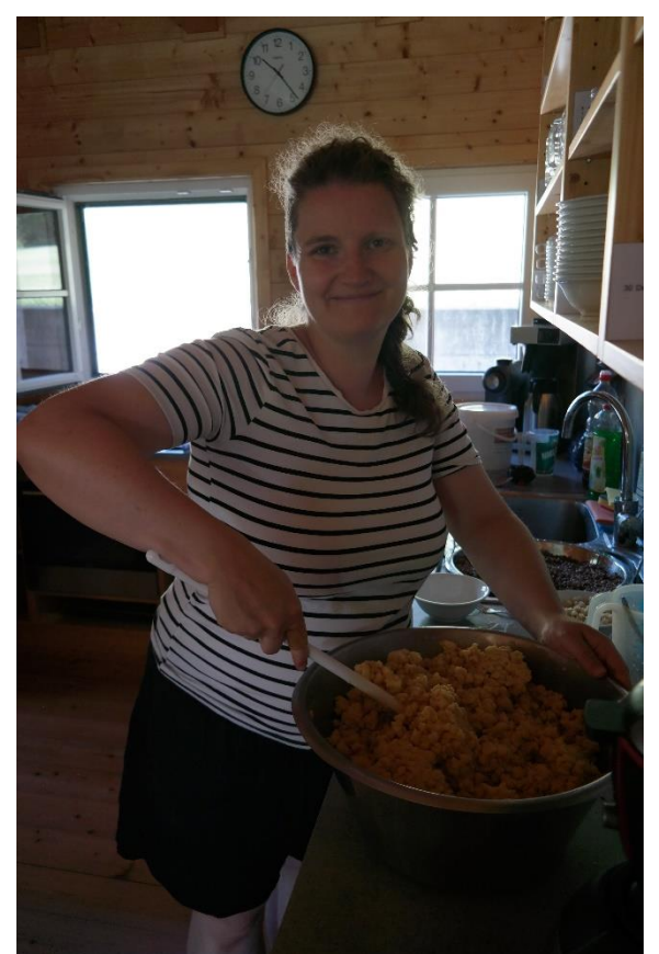
7Semmelknödel - ohne Petersilie :-)