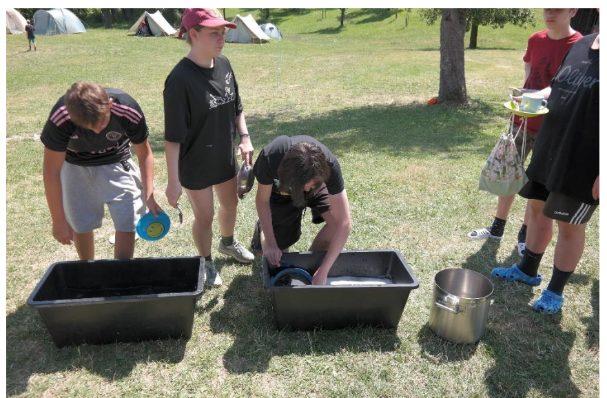
91Die CaEx lieben Geschirrwaschen :-)