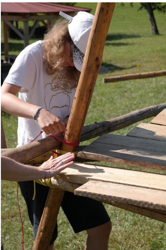
5Die CaEx bauen ihre Kochstelle