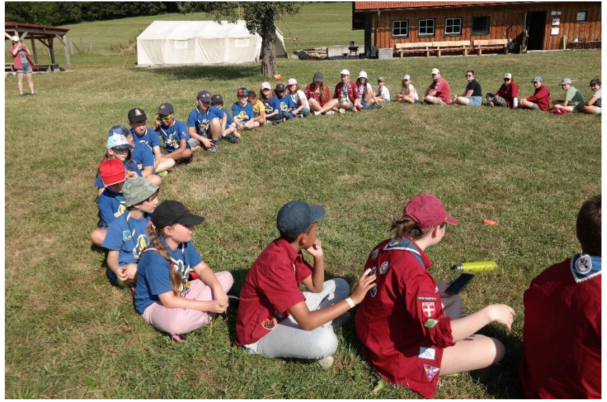
2Meditation der CaEx (Regenmassage)