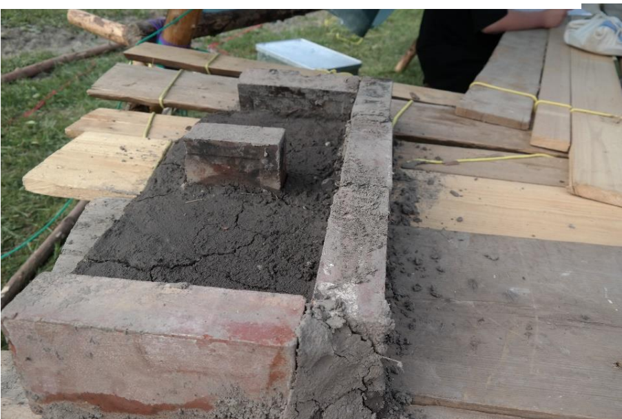
Die Feuerstelle der CaEx