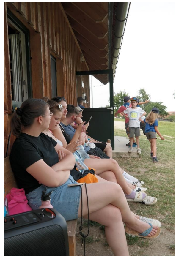
RaRo beim Arbeiten