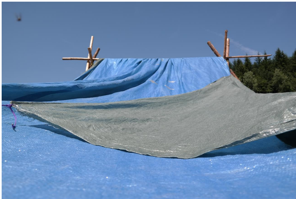
Was ist das?

Die GuSp beendeten ihren Tag mit einem Nachtspiel.