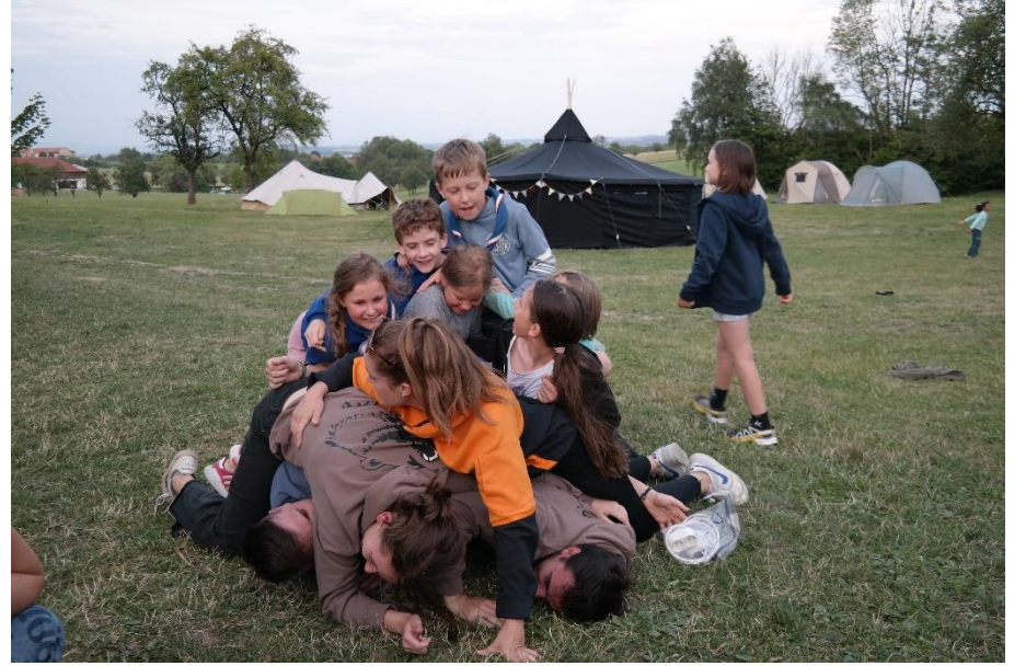
Unten RaRo, oben WiWö