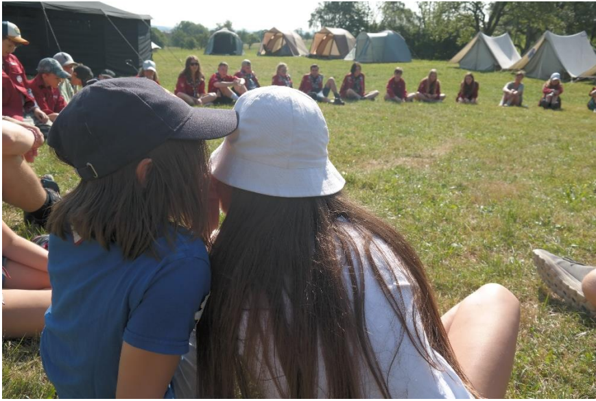
1Meditation der CaEx (Stille Post)