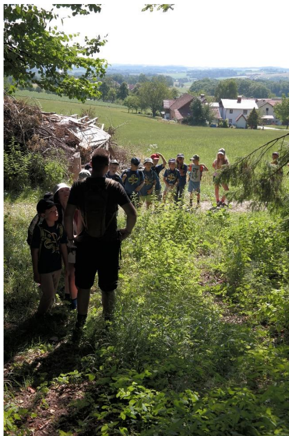
6Die WiWö bei der Ortserkundung