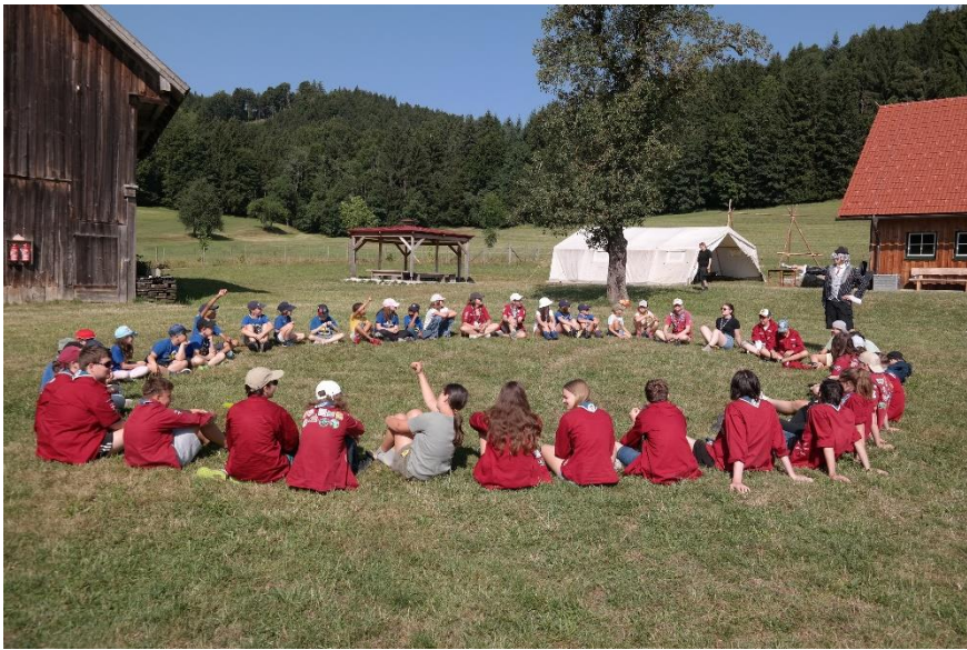
3Der Zirkusdirektor braucht unsere Hilfe!