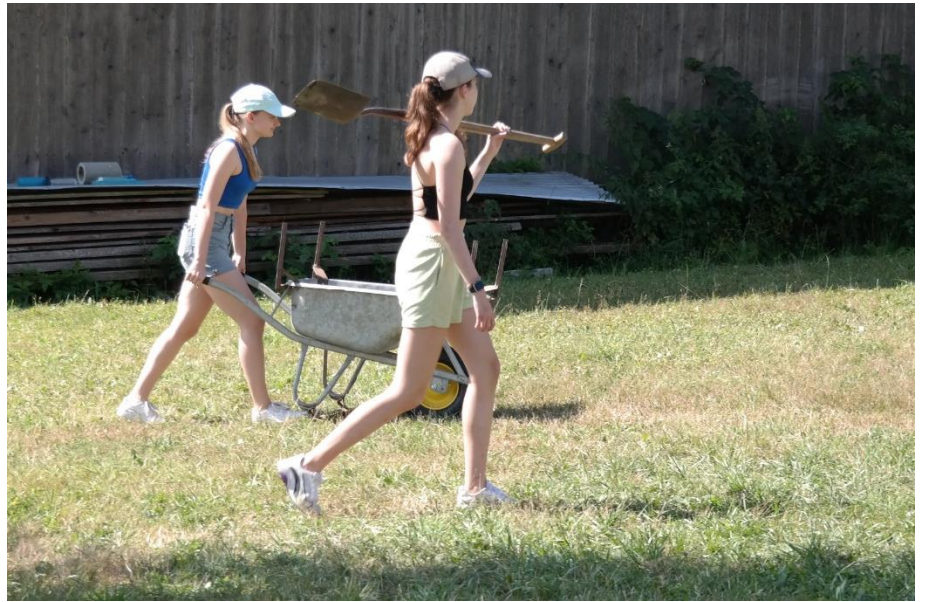
4: Die CaEx bei der Arbeit