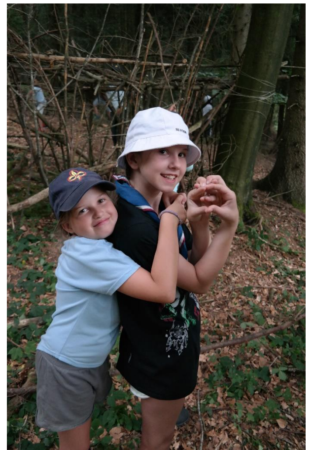
Best Friends bei dem Löwenkäfig