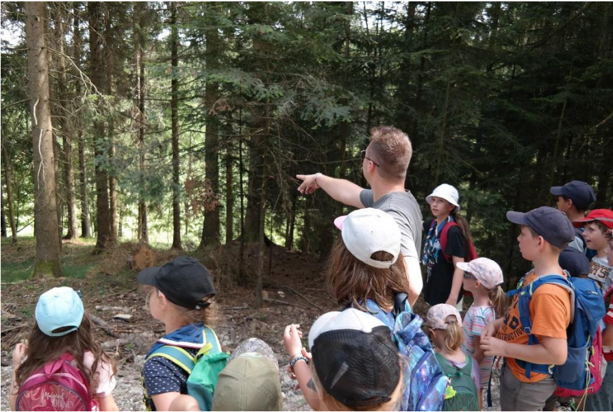
Die WiWö finden den idealen Platz für den Löwenkäfig