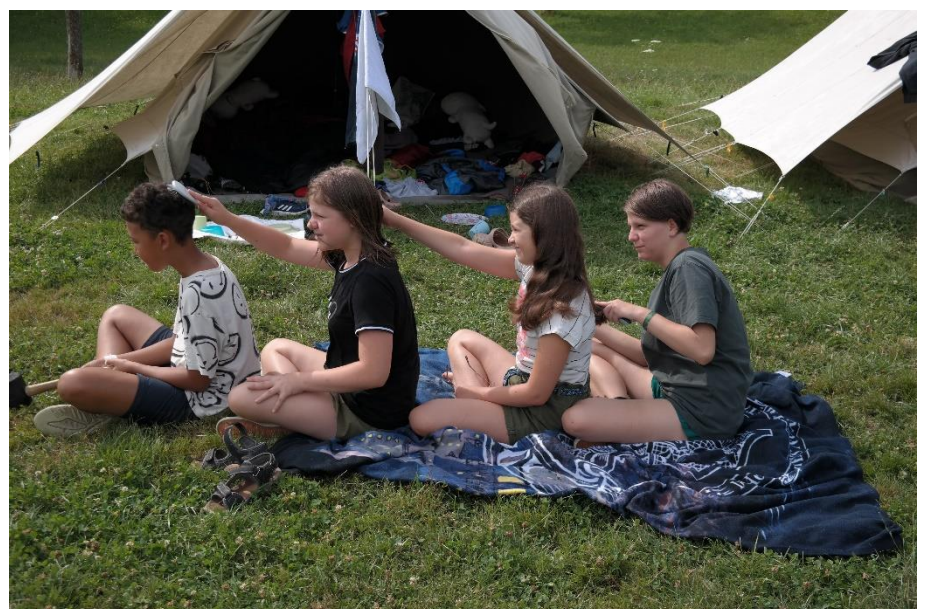
Haarpflege bei den GuSp