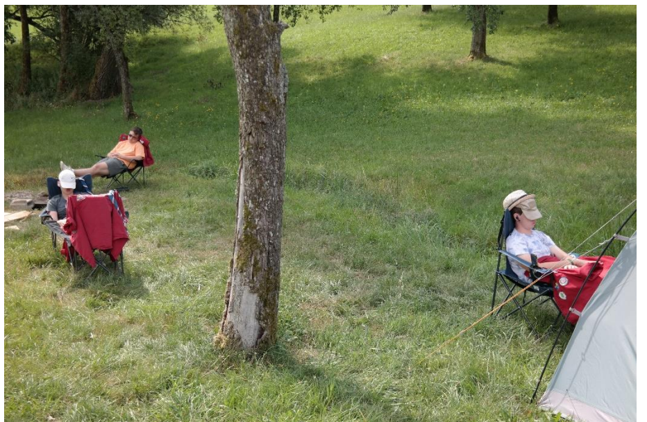
RaRo bei der Arbeit..