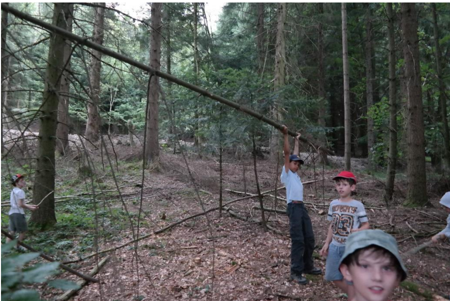
Wer trägt hier wen?