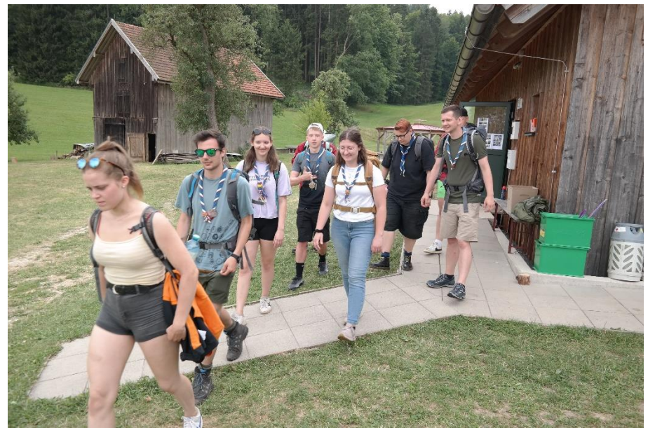
Die RaRo starten zu ihrer Wanderung