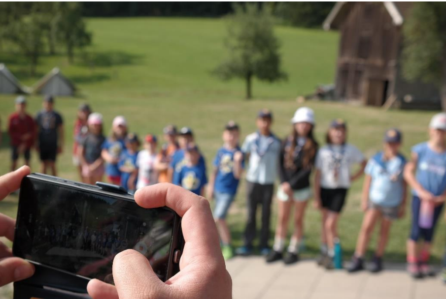
Happy Birthday, Messua!