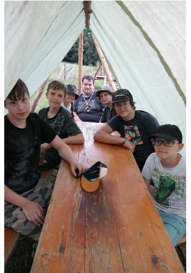
Die GuSp in ihrer "krassen Hütte"