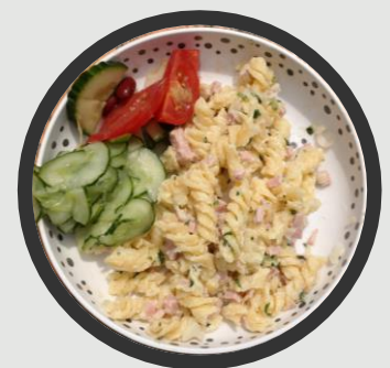
Schinkenfleckerl mit Salat