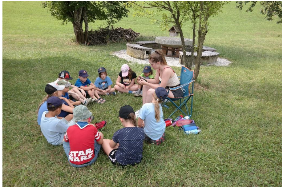
Erste Hilfe bei den WiWö