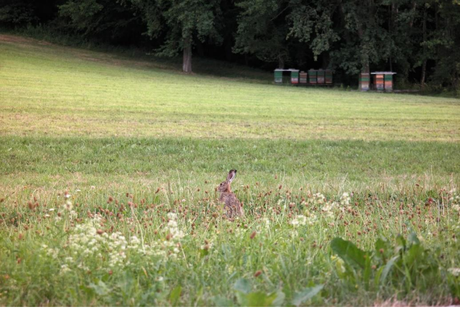
Besuch eines Feldhasens