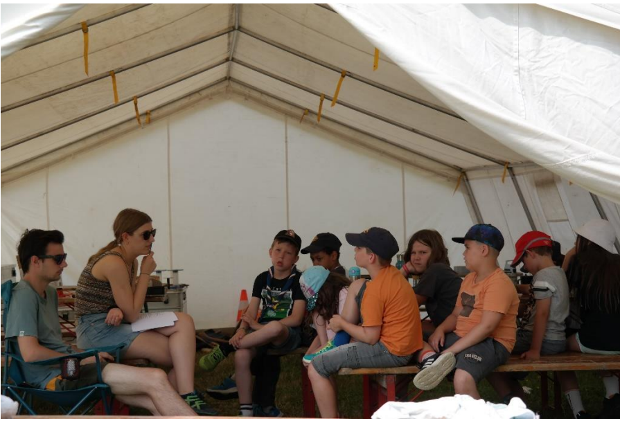
WiWö beim Spezialabzeichen "Kritiker"