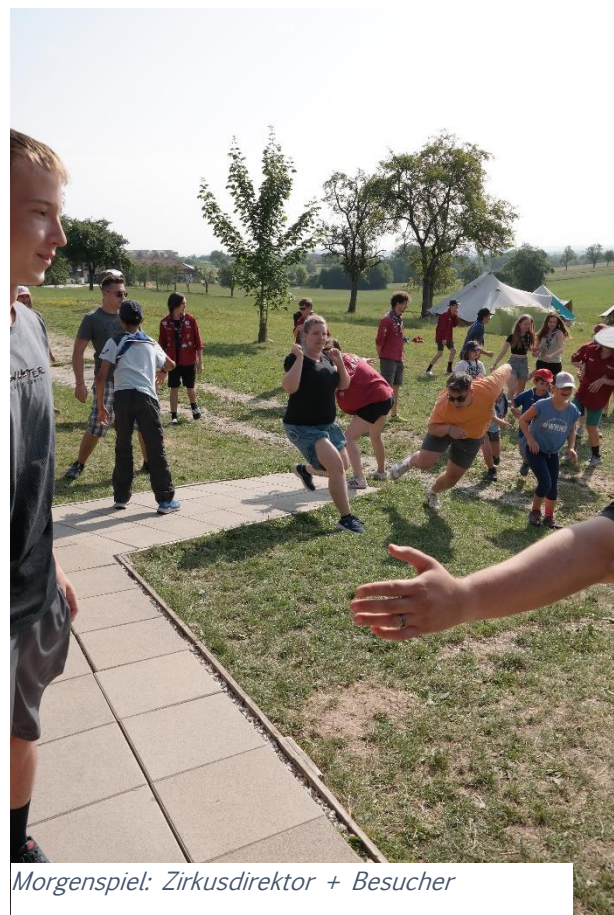
Morgenspiel: Zirkusdirektor + Besucher