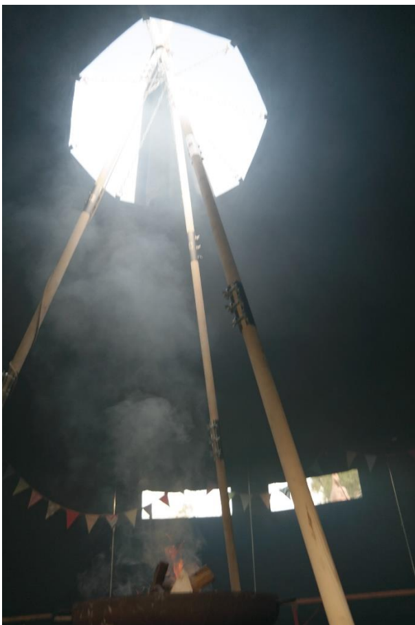
Feuer in der Jurte